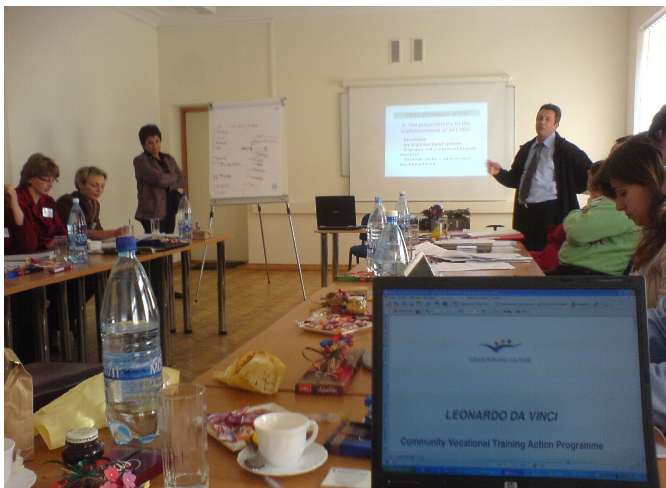
Illustration 1: workshop durant le séminaire à Kaunas (Lithuanie) avec les participants invités de tous les pays, avril 2006