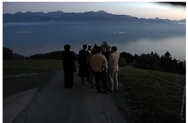
Illustration 4: Les partenaires EU à la Tour de Gourze, sur le Léman

Les partenaires européens nous ont fait part de leur satisfaction quant à la participation de la Suisse dans projet, au niveau des contributions pédagogiques et stratégiques. Nous leur avons aussi organisé une visite touristique d'une soirée sur le Léman durant leur en Suisse.